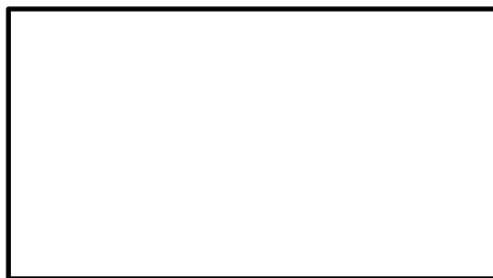
ภาพที่ 1 นวัตกรรมเครื่องทอเสื่อกกบ้านหนองนกปีกกา

สามารถนำรูปถ่ายประกอบให้เห็นภาพชัดเจนขึ้นโดยทุกภาพ ควรเป็นภาพที่มีความคมชัดมีรายละเอียดชัดเจน และทุกภาพต้องมีคำบรรยายใต้ภาพที่มีความยาวไม่เกิน 2 บรรทัด อยู่ใต้รูปภาพไว้ และอธิบายรายละเอียดถึงภาพประโยชน์ของนวัตกรรมหรือเครื่องมืออื่นๆได้